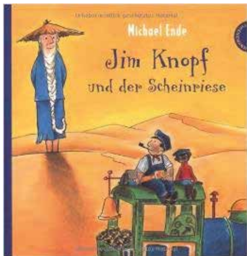
Jim Knopf und der Scheinriese

Bilderbücher sind eine Schatzgrube zum Entdecken, Staunen und Lachen - sie fördern die Sprachfähigkeit und Lesekompetenz, erweitern das Wissen, vermitteln Werte, wecken Kreativität und machen großen Spaß.